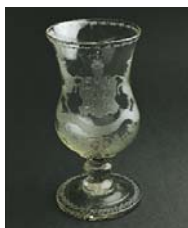
Pokal mit württembergischen Wappen

sich teure Kleider und Kunstwerke leisten und natürlich standesgemäß heiraten. Besonders die von Schmidfeld schrieben eine Erfolgsgeschichte. Der Alltag der einfachen Glasmacher – geschildert in der Schürerstube – war dagegen hart. Aber sie verdienten gut. Man kannte sie als lustige (und durstige) Gesellen.