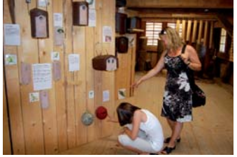
Ausstellung in der Naturschutzstation