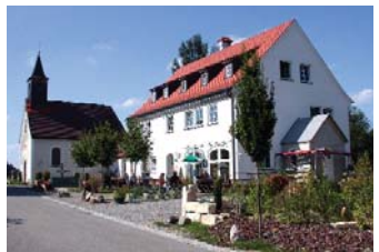
Café/Bistro „Remise“ mit Kapelle

„brandgefährlichen“ Glasmacherdorf besonders zu verehren. In der „Remise“, einem Mehrzweckbau, lädt das gleichnamige Café/Bistro zum gemütlichen Verweilen ein. Wenn's warm ist, sitzt man draußen und lauscht dem Plätschern des großen Brunnens.