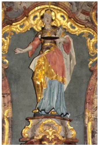
Hl. Agathe auf dem Altar in der Kapelle

„brandgefährlichen“ Glasmacherdorf besonders zu verehren. In der „Remise“, einem Mehrzweckbau, lädt das gleichnamige Café/Bistro zum gemütlichen Verweilen ein. Wenn's warm ist, sitzt man draußen und lauscht dem Plätschern des großen Brunnens.