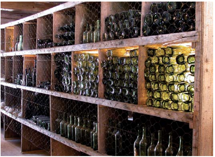
Ein Blick ins Glasmagazin