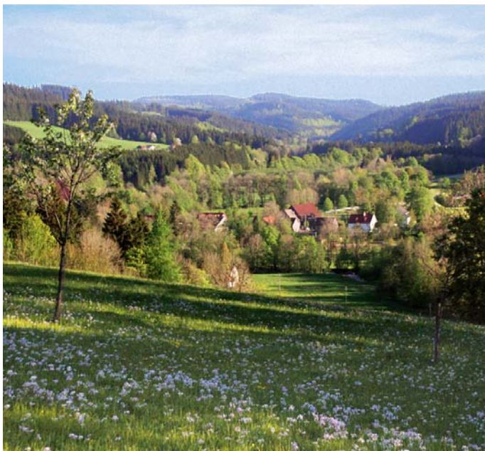
Blick über das Eschachtal auf Schmidsfelden und den Schwarzen Grat