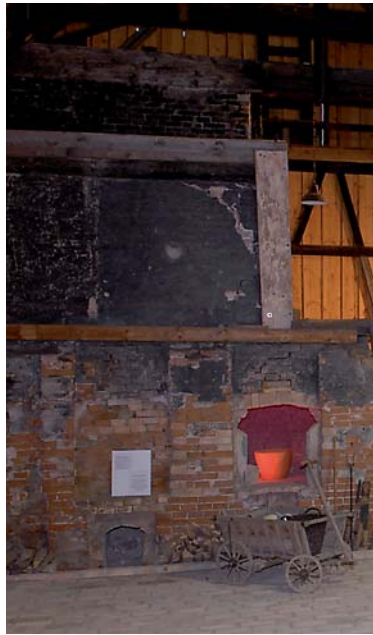
Glashütte mit den alten Öfen