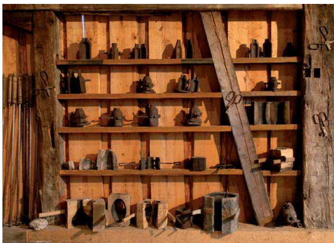
Formen zur Glasherstellung