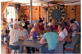
Erdgeschoss im Glasmagazin

Schmidfelder Schaukel, auf der sich die Kinder austoben können. Dann folgen inmitten von hübschen Gärten einfache, traufständige Wohngebäude, in denen die Arbeiter lebten: Glasmacher, Schürer, Schmelzer, Handlanger... Im letzten Haus vor der Eschach lief die Sägemühle, angetrieben vom Wasser des einst offenen Sägebachs. Die Eschach bildet die Grenze zwischen Bayern und Baden-Württemberg. Ein hl. Nepomuk soll vor den Gefahren dieses recht launischen Flusses Schutz bieten. Auf bayerischem Boden steht das „Unterhaus“, einst Gästehaus und Alterswohnsitz deren von Schmidfeld.