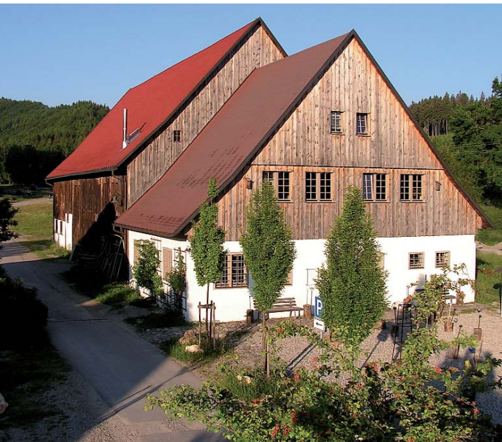
Glashütte mit Museum

Schmidtsfelden, auf halbem Weg zwischen Leutkirch und Kempten, zählt zu den wenigen erhaltenen Glasmacherdörfern in Deutschland.