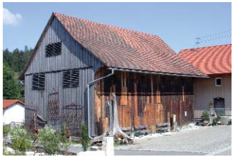
Glasmagazin mit Naturschutzstation

Als einziges Gebäude wendet das ehemalige Verwalterhaus den Giebel zur Straße. In seinem Dachgeschoss lagerte einst das Getreide. Ihm gegenüber eine Nachbildung der berühmten