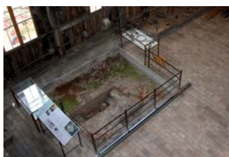
Ausgrabung eines Streckofens