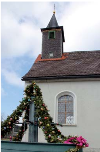
Brunnen im Osterschmuck