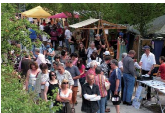
Markttreiben im Mai

Schmidfelder Schaukel, auf der sich die Kinder austoben können. Dann folgen inmitten von hübschen Gärten einfache, traufständige Wohngebäude, in denen die Arbeiter lebten: Glasmacher, Schürer, Schmelzer, Handlanger... Im letzten Haus vor der Eschach lief die Sägemühle, angetrieben vom Wasser des einst offenen Sägebachs. Die Eschach bildet die Grenze zwischen Bayern und Baden-Württemberg. Ein hl. Nepomuk soll vor den Gefahren dieses recht launischen Flusses Schutz bieten. Auf bayerischem Boden steht das „Unterhaus“, einst Gästehaus und Alterswohnsitz deren von Schmidfeld.