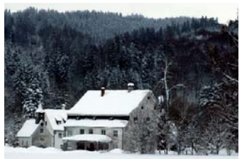
Das Oberhaus mit dem mächtigen Dach